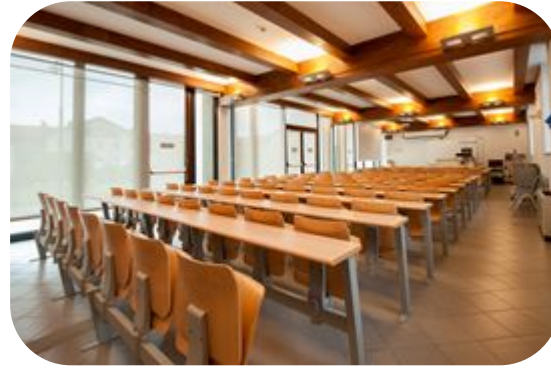
Aula Miroglio: capienza 100 persone 450€+ IVA 22% giornata intera (280€ mezza giornata)