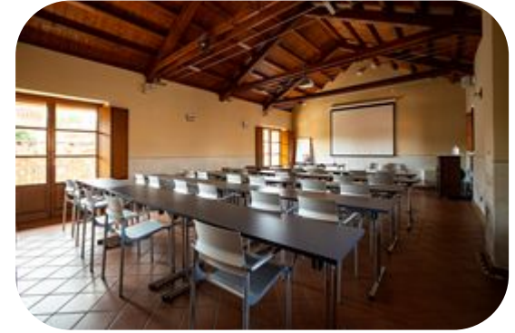
Sala Blu: capienza 30 persona 400€+ IVA 22% giornata intera (225€ mezza giornata)