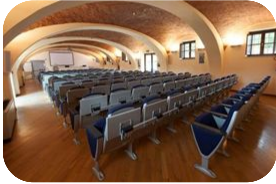
Aula Magna: capienza 150 persone 600€+ IVA 22% giornata intera (350€ mezza giornata)