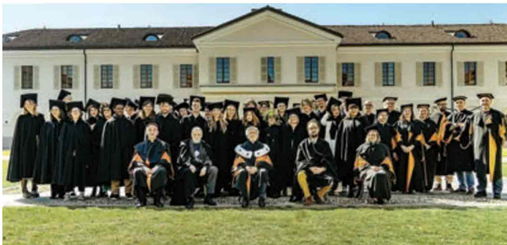
Un momento della giornata della consegna delle lauree. Sotto: Frans Timmermans, vicepresidente esecutivo Ue.

S ono stati 28 i giovani protagonisti del graduation day (giorno della laurea), tenutosi nella sala rossa dell'Università di scienze gastronomiche nella giornata di venerdì 10 marzo: sono stati 16 gli studenti della laurea triennale e 12 quelli della magistrale in Food innovation and mana-