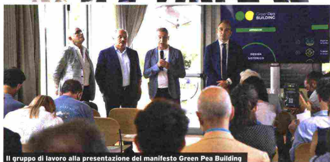
Il gruppo di lavoro alla presentazione del manifesto Green Pea Building